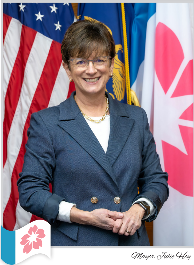
Mayor Julie Hoy